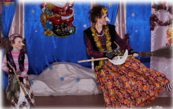
в номинации «Мы из сказочной страны»