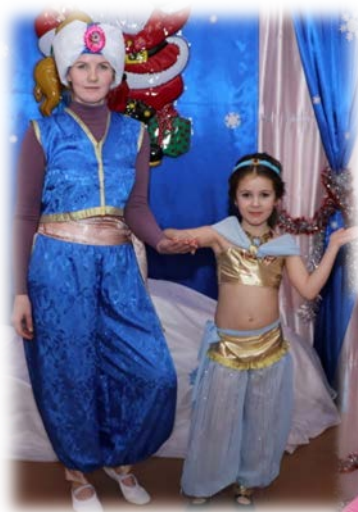
в номинации «Яркий образ»