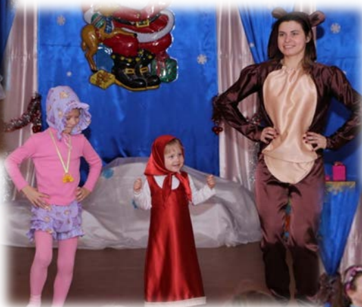
в номинации «Точь- в-точь»